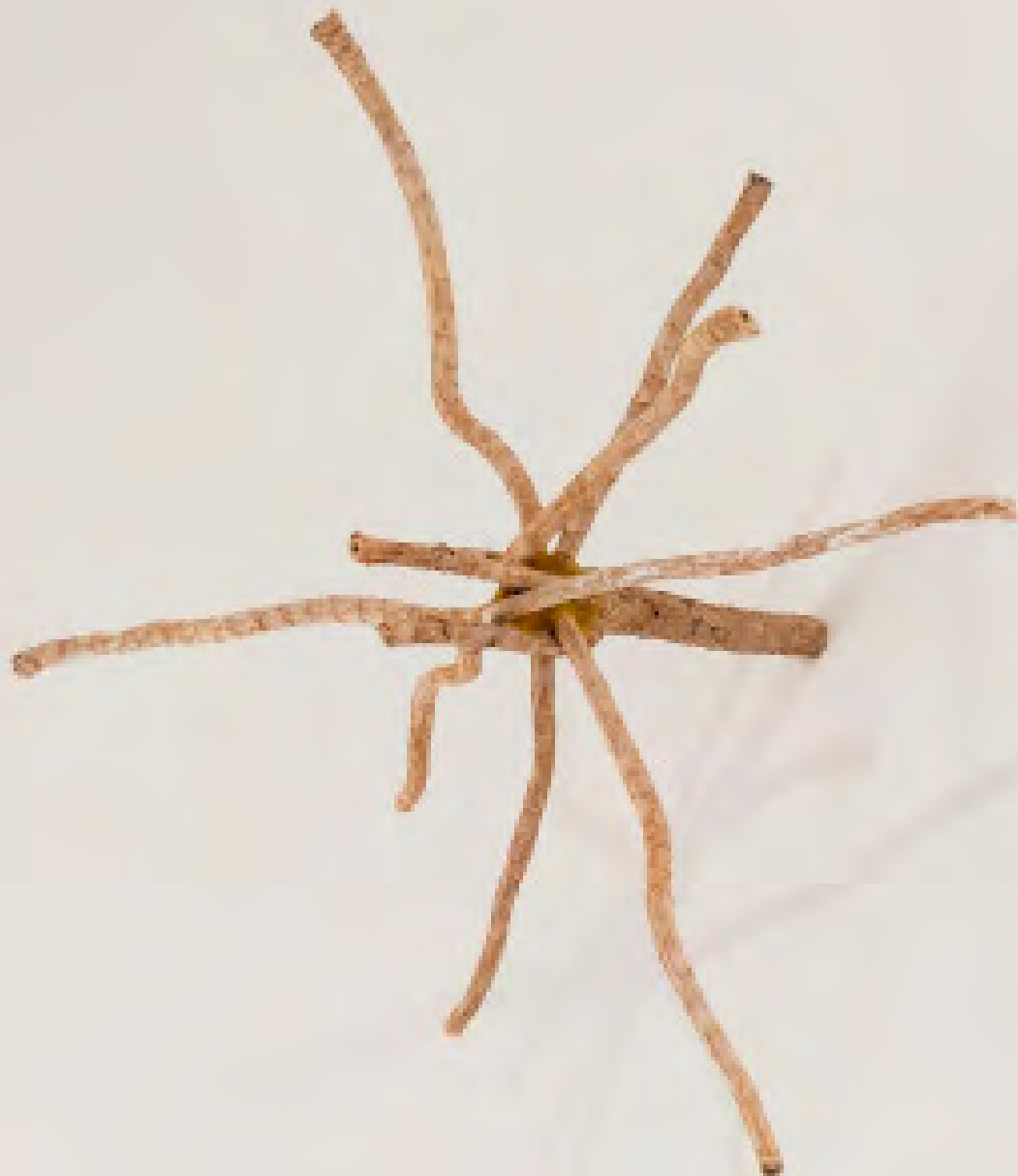
Synaps sol mixed media