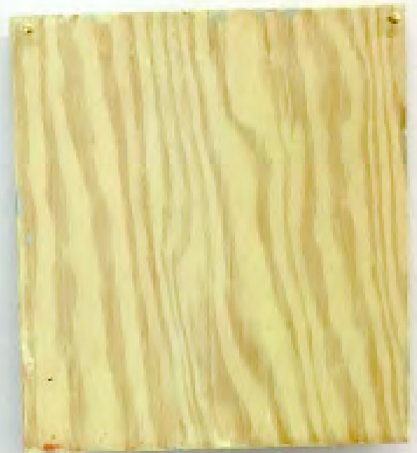
Ur serien kvadrater till Sylvia