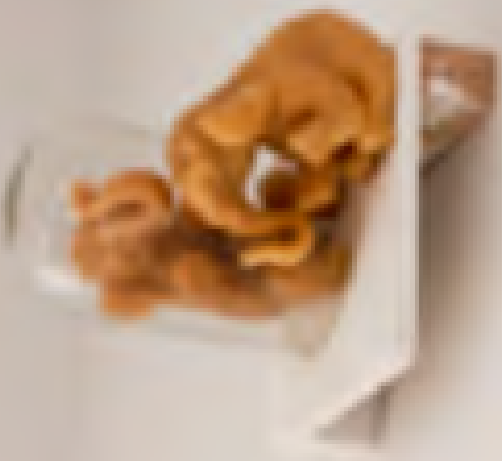
Elefanter mixed media